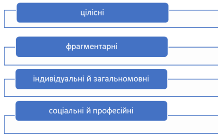
Рис. 3. Основні ознаки картин світу

Українські дослідники (О. Селіванова, Т. Вільчинська, Т. Космеда), звертаючи увагу на питання розмаїття картин світу, зокрема, аналізують обсяг цих картин, способи систематизації їхнього змісту, структурування, атрибутивні характеристики тощо (Рис.3).