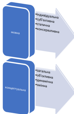
Рис. 2. Розрізняльні ознаки картин світу

Звертаючи увагу на співвідношення мовної та концептуальної картин світу, аналізують обсяг цих картин, способи систематизації їхнього змісту, структурування, атрибутивні характеристики тощо. При цьому більшість погоджується, що обидві картини світу взаємопов'язані, хоч і мають певні відмінності. На основі аналізу праць українських дослідників сформовано розрізняльну таблицю мовної та концептуальної картин світу (Рис.2).