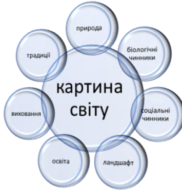
Рис. 1. Чинники формування картини світу

Вчені доводять, що менталітет будь-якого лінгвокультурного співтовариства зумовлений значною мірою його картиною світу. Її можна назвати знанням про світ, лежить в основі індивідуальної й суспільної свідомості. Мова ж забезпечує вимоги пізнавального процесу [4, с. 49]. Як відомо, на формування картини світу впливають багато факторів (Рис.1).